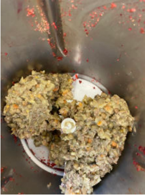
Der Rest Linseneintopf

Wenn vom letzten Linseneintopf noch ein Rest übrig ist, gibt es leckere Linsenbratlinge: