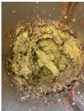
Würzen mit Salz und der Selber hergestellten Gemüsebrühe „Allerköner“