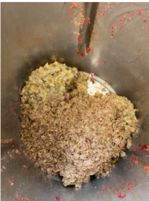
Etwas geschroteter Leinsamen