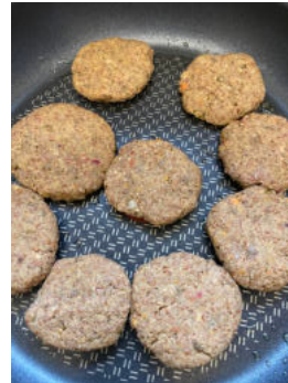
In etwas Öl braten.